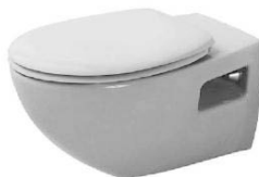
Vaso Duravit serie Duraplus