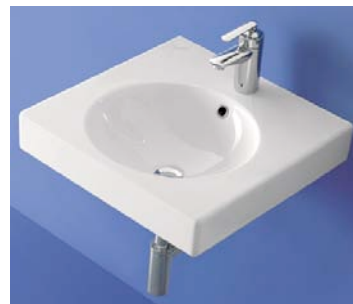
Lavabo Ceramiche Dolomite mod. Asolo