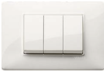
Vimar serie Plana