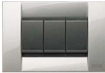
Vimar serie Idea