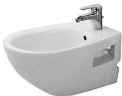
Bidet Duravit serie Duraplus