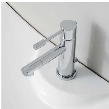
Miscelatore Zazzeri serie Modo