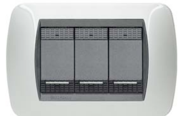
Bticino serie Living

Segue tabella con numero di punti luce e prese corrente per appartamento tipo: