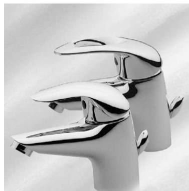
Miscelatore Zucchetti serie Elfo

Tutti i locali saranno provvisti di chiavi di arresto per acqua calda e fredda.